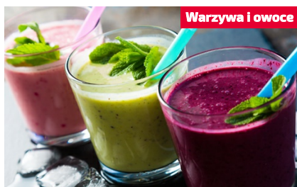
Warzywa i owoce